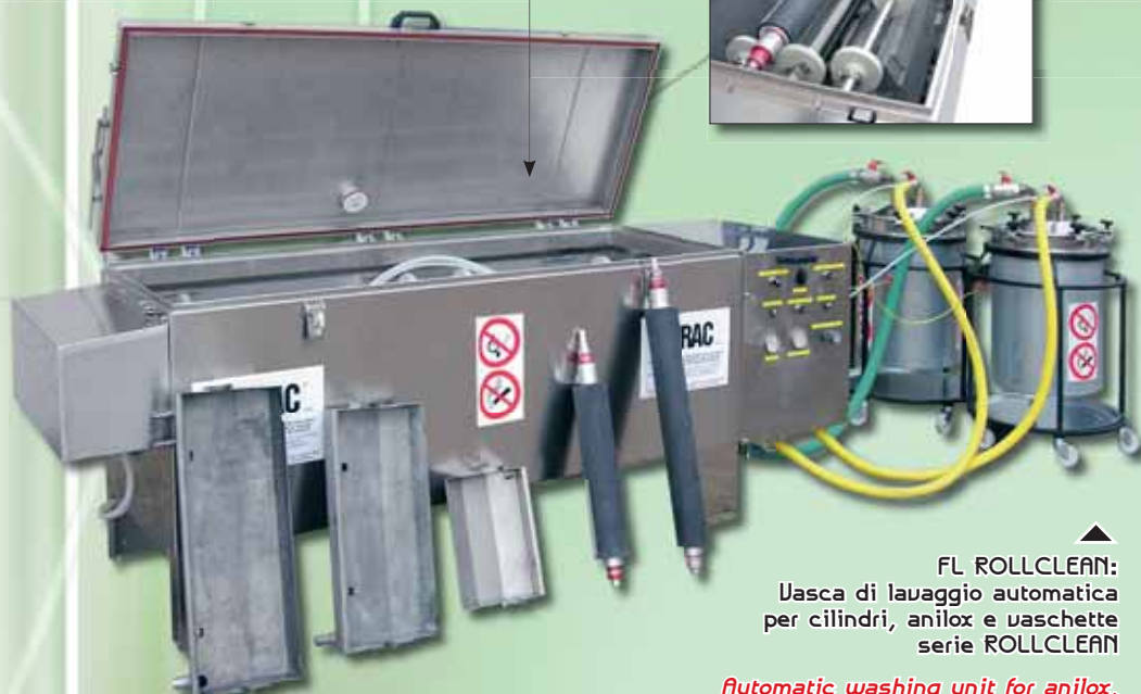
FL ROLLCLEAN: Vasca di lavaggio automatica per cilindri, anilox e vaschette serie ROLLCLEAN

Automatic washing unit for anilox, cylinder and ink trays ROLLCLEAN series